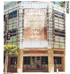
El edificio abrirá nuevamente el martes 29 de julio.

Durante esos días, se limpiará y arreglará el sistema de acondicionadores de aire y se dará mantenimiento a los servidores del sistema de computadoras, agregó mediante comunicado de prensa.